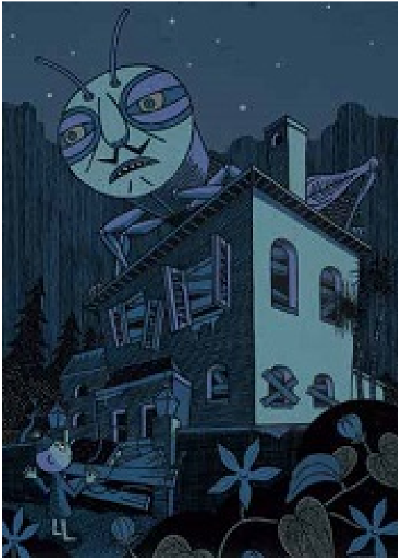
●夜の訪問者 -III/A NIGHT VISITOR-III イラストレーション：野崎真澄 (chips) illustration: NOZAKI Masumi(chips)/acrylic on board W420mm H594mm