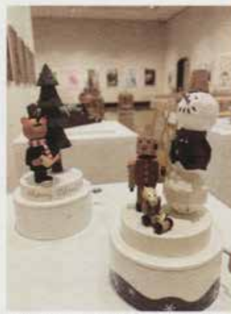
風合いも表情もあたたかい、木製の立体作品