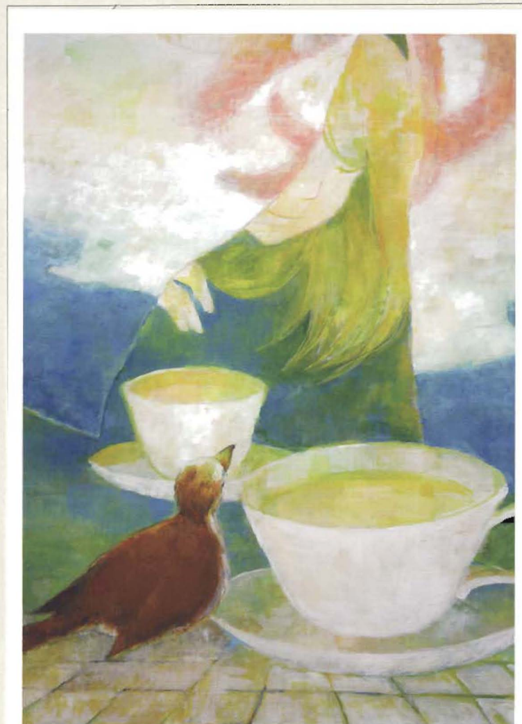
かっこう×ゆーゆー 志牟田夏紀/絵